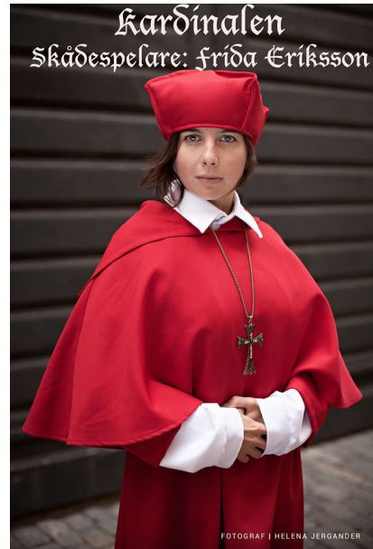
Modern teaterföreställning om Luther