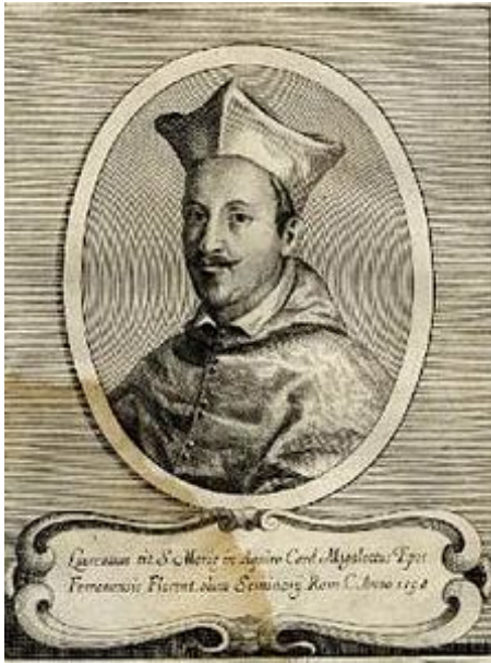
Lorenzo Magalotti, 1637-1712 cardinal